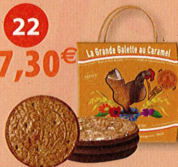
GRANDES GALETTES AU BEURRE ET AU CARAMEL DUPONT D'ISI- GNY (10 sachets fraîcheurs x 3) - 500 g