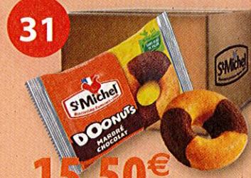
50 DOONUTS MARBRÉS 30 g Boîte de 1500 g