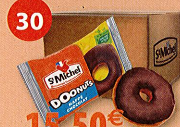
50 DOONUTS NAPPÉS 30 g Boîte de 1500 g