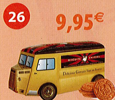
10 SACHETS DE 3 GALETTES CAMIONNETTE CITROËN Coffret de 195 g