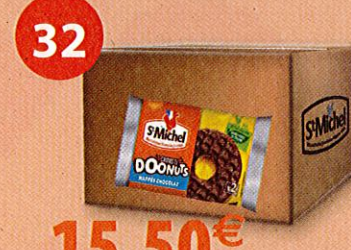
50 CROUSTI DOONUTS 30 g Boîte de 1500 g