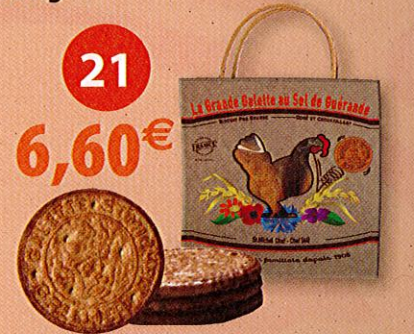
GRANDES GALETTES AU BEURRE ET AU SEL DE GUÉRANDE (10 sachets fraîcheurs x 3) - 500 g