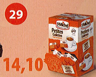
200 PETITES GALETTES AU BEURRE Boîte de 700 g