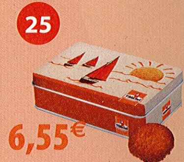
COFFRET VOILIERS 8 SACHETS DE 3 ROUDOR Boîte de 300 g