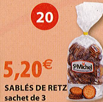
SABLÉS DE RETZ sachet de 3 450 g