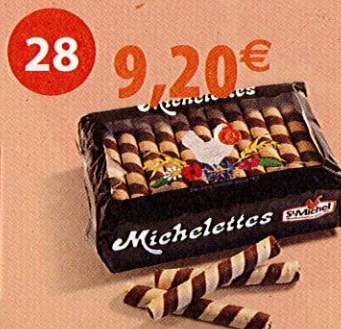
45 MICHELETTES Barquette de 380 g