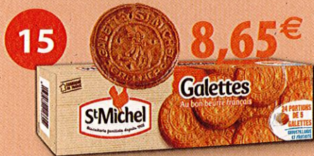
ETUI GÉANT GALETTES 6 paquets de 20 galettes Étui de 780 g