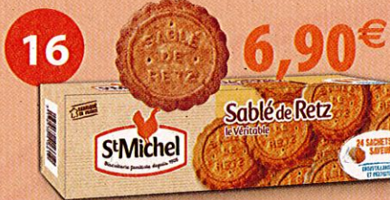
ETUI GÉANT SABLÉS DE RETZ 6 paquets de 20 sablés Étui de 720 g