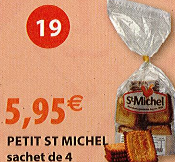
PETIT ST MICHEL sachet de 4 540 g