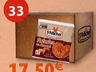
60 PALMIERS CARAMEL 16,6 g Boîte de 996 g