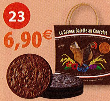
GRANDES GALETTES AU CHOCOLAT (10 sachets frai- cheurs x 3) - 500 g