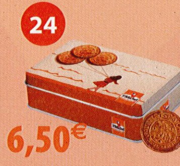
COFFRET FILLE AUX BALLONS 8 SACHETS DE 5 GALETTES Boîte de 325 g