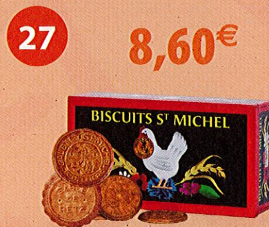
COFFRET 1967 GALETTES SABLÉS DE RETZ Boîte de 375 g