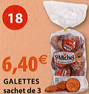
GALETTES sachet de 3 487 g