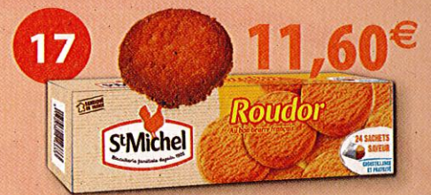
ETUI GÉANT ROUDOR 6 paquets de 12 Roudor Étui de 900 g