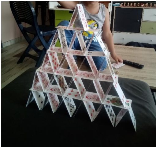
TIMÉO : 52 CARTES